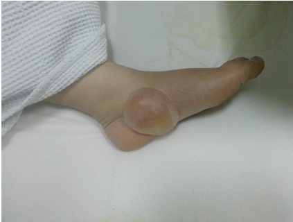
Resim 1. Hastanın sol ayak bileğindeki 7x8 cm çapında bül

Hasta entübe edilerek solunum desteği sağlandı ve gerekli sıvı tedavisi başlandı. Beyin tomografisi normal değerlendirilen hastanın beyin MR görüntülenmesinde bilateral globus pallidusda hiperintens odaklar tespit edildi (Resim 3). Takibinin 4. saatinde şuuru açılan hasta extübe edildi. Batın ultrasonografi ve diğer ayırıcı tanı için yapılan kontrol laboratuar ve tetkiklerinde anormallik saptanmayan hasta yatışının 4. Gününde şifa ile taburcu edildi.