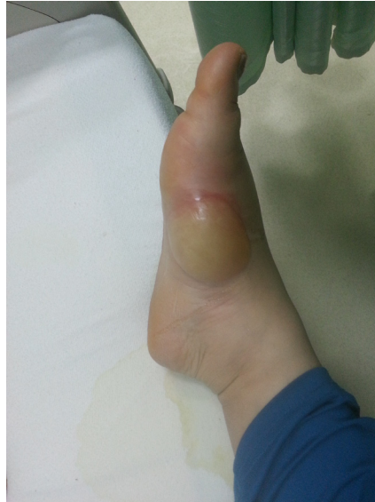
Resim 2. Hastanın Sağ ayak bileğinde 6x7 cm çapında bül