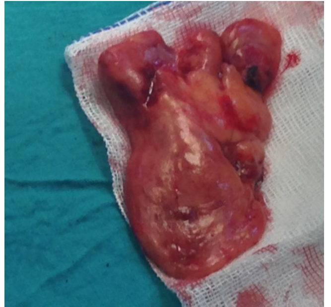
Şekil 2. Eksizyon sonrası dev paratiroid adenomunun görünümü